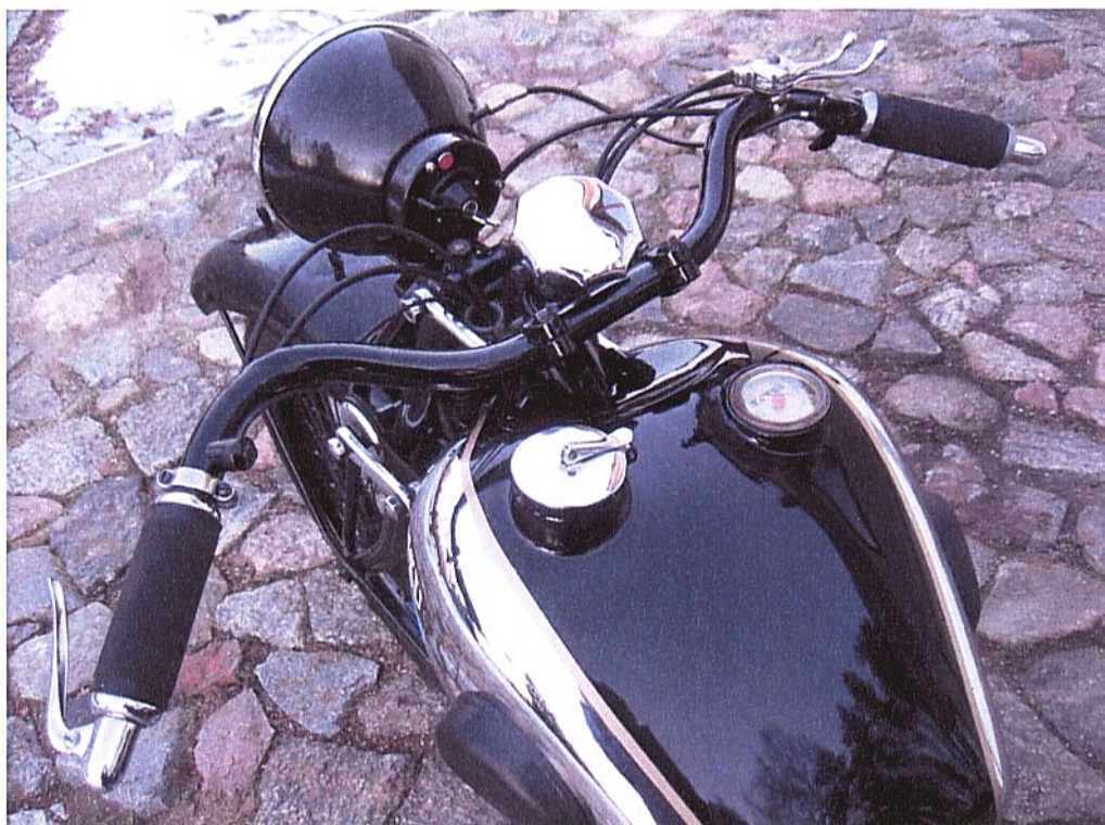
Vaade sõiduki juhtimisseadmetele