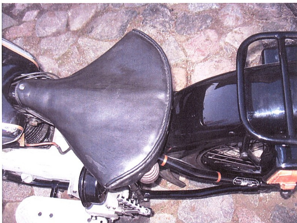
Vaade sõiduki istme(te)le