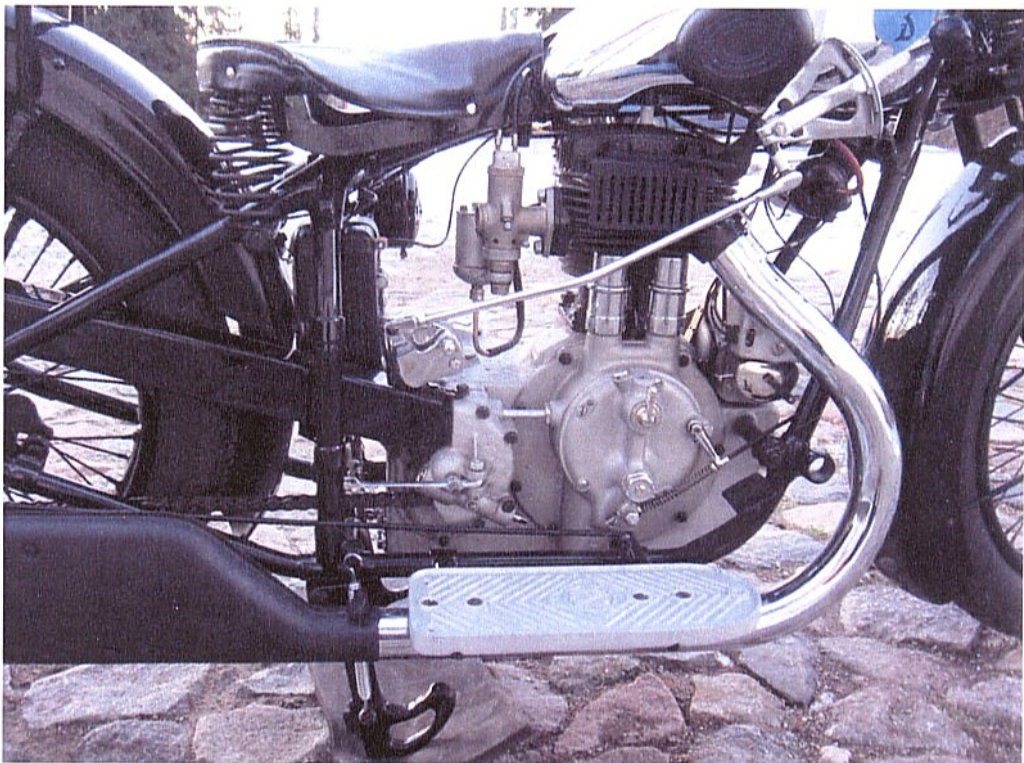
Vaade mootorile teiselt küljelt